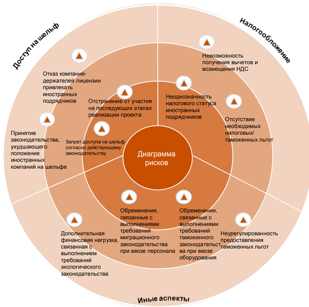
Диаграмма рисков шельфовых проектов